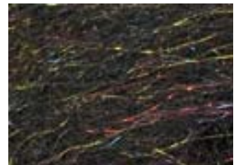
Merino - Glanzgarn